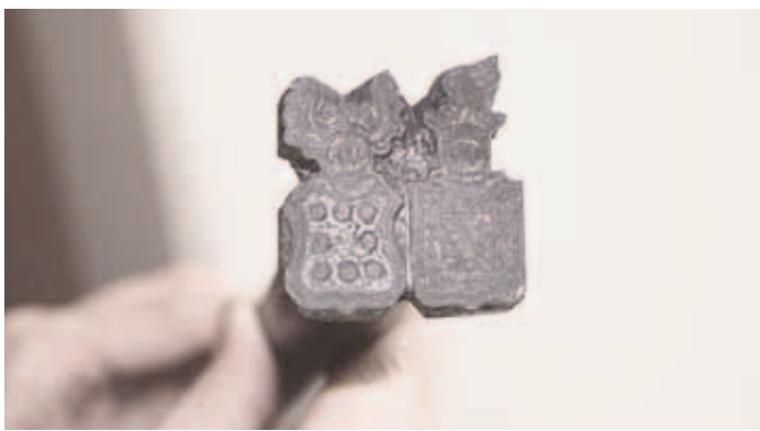
Sellist omanõulist templit pole Jõelähtme Vallalehe andmetel ühelgi teisel mõisal (andmed ametlikult kinnitamata).