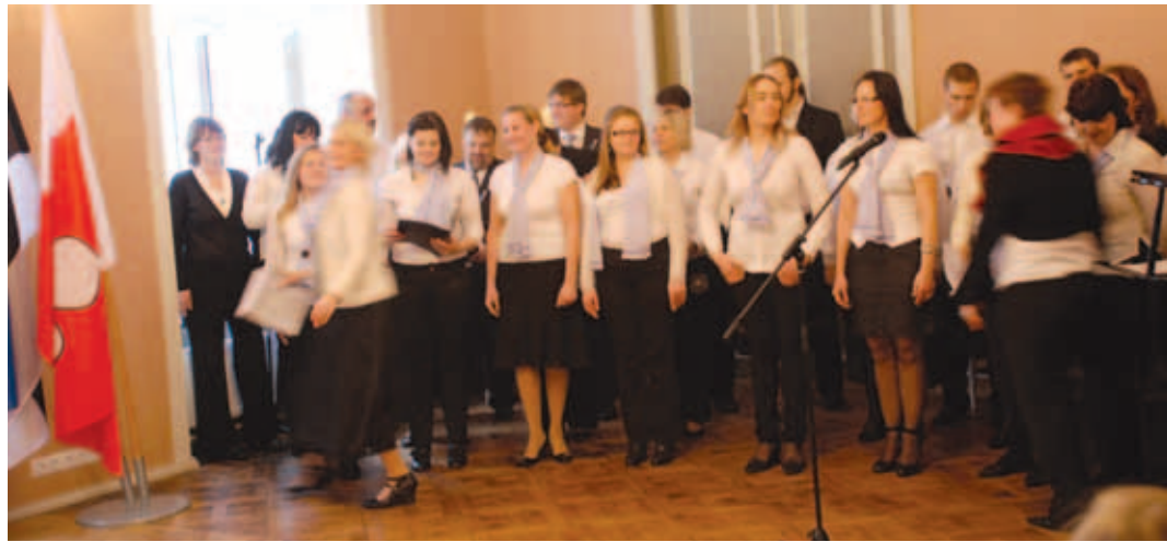
Kostivere koor kultuurimõisa avapeol.

Rääkides laulupeo hetke seisust, on rõõm tõdeda, et laulupäevale on registreerunud 22 erinevat laulukollektiivi 435 lauljaga ja 19 tantsurühma 257 tantsijaga. Kõige arvukamalt on esindatud segakooriliik, kokku 185 lauljat. Ja kui nüüd jätkab tööd ka Kostivere segakoor, siis saab see number olema üle 200. Enamus lauljaid tuleb Kuusalu ja Jõelähtme vallast, aga meiega ühinevad ka Rae perekoor ja segakoor Sõprus. Tantsijate arvukama osa moodustavad noored, esindatud on nii 1.-3. klasside rühmad, kokku 61 tantsijat, 3.-4. klasside, 5.-6. klasside, 7.-9. klasside rühmad. Naisrühma-