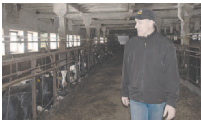
Piima tasub jälle toota

Kevade saabudes vahetatakse talvekasukas suvisema vastu välja. Vana karv tuleb kindlasti välja kammida, sest selline vilt niiskub ning loob soodsa pinnase nahapõletike tekkeks. Kammida tasub ka kasse, sest