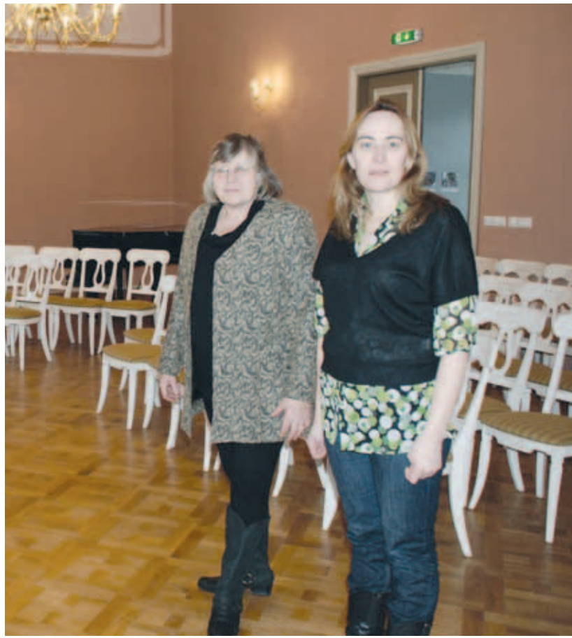
reiberg ja Kaili Raamat.