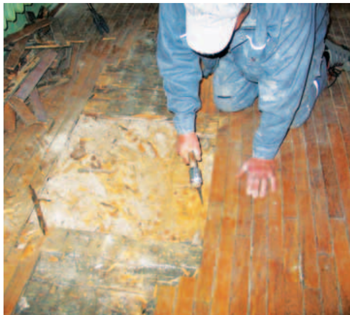
Enne kui remont ette võtta, tuleb ikka uurida, mida täpselt remontida.

■ Algas kõik sellest, et ajaloolisel Kostivere külal (ajaloos märgitud esmakordselt 1241), mis ammugi alevikuks kasvanud, pole kunagi alevikuvanemat olnud. Et kodanikuühiskond muutub aga aina enam elujulisemaks, otsustasid Kostivere elanikud kokku tulla ja endile eestseisjad valida. Sellised, kes suudaksid aleviku rahvast kaasates paikkonna heaks midagi ära teha.