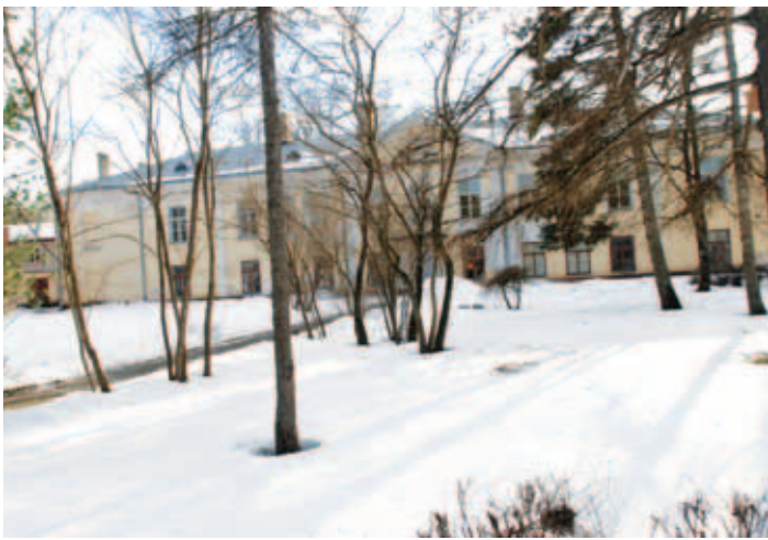
Kostivere mõisa välisvaade – märts 2012.