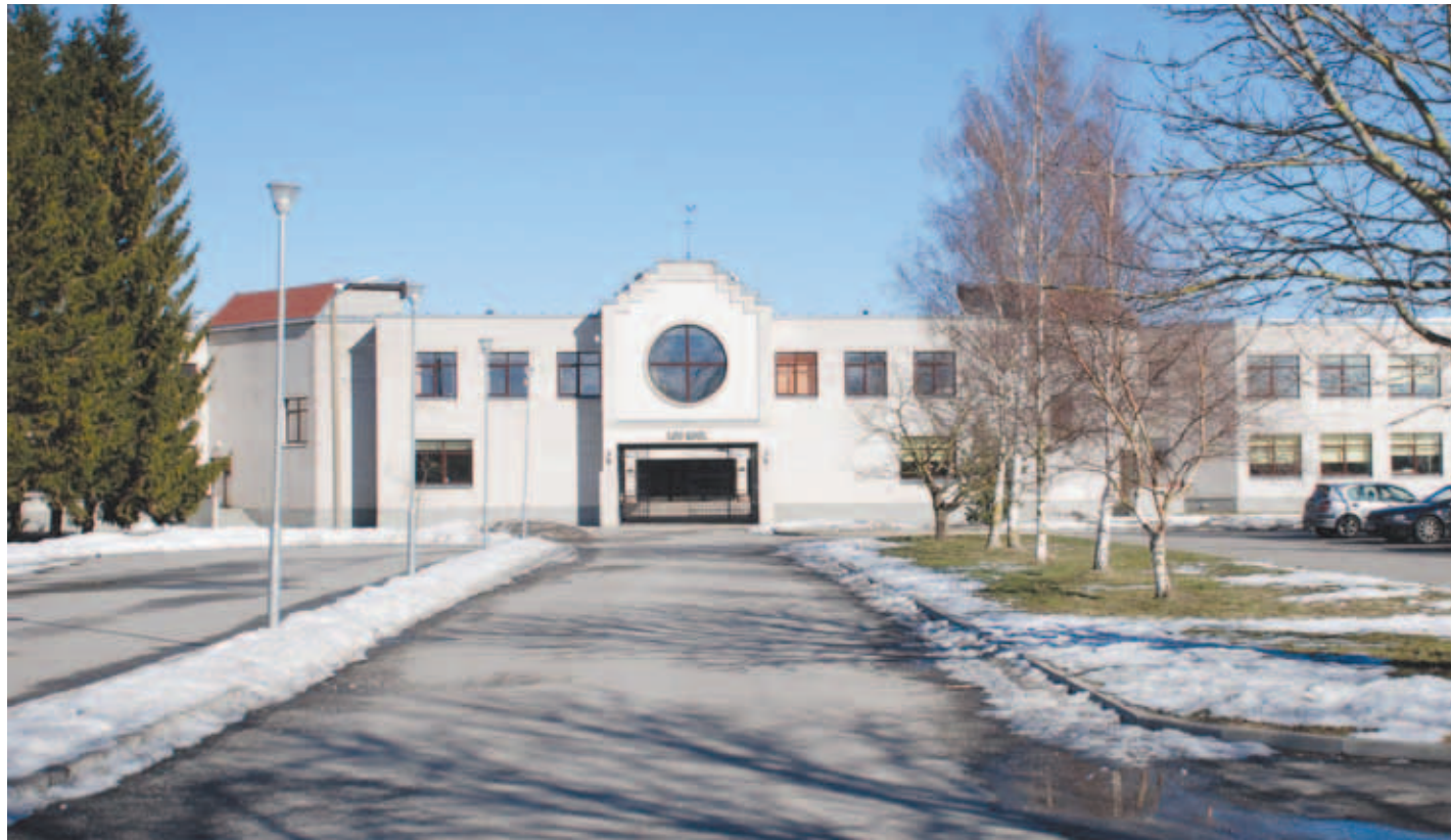
Loo kool pole küll vana, ees ootav soojustamine aitab ometigi küttekulusid kokku hoida.